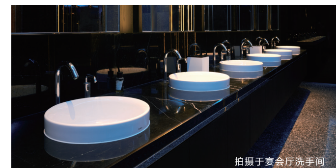
拍摄于宴会厅洗手间