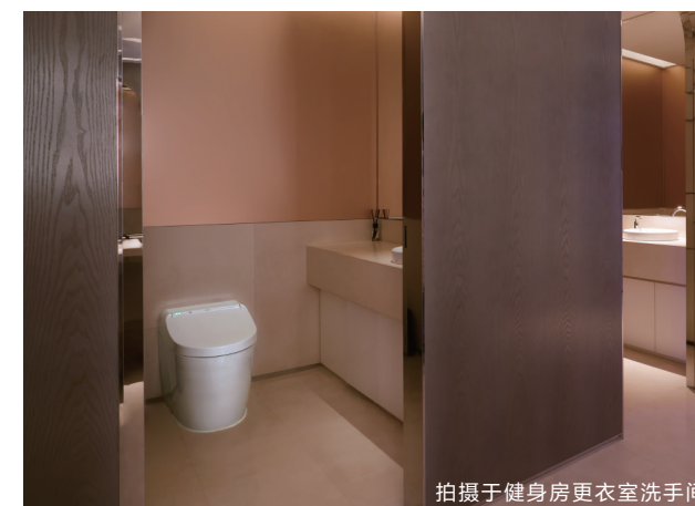
拍摄于健身房更衣室洗手间