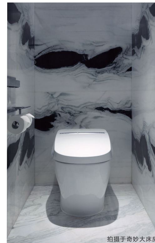
拍摄于奇妙大床房