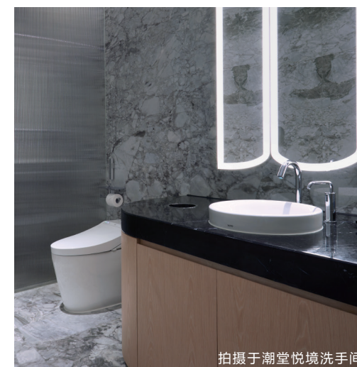
拍摄于潮堂悦境洗手间